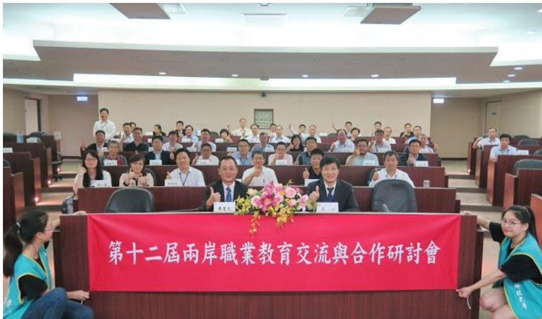
本校與會主管與山東省教育團貴賓合影

此次參訪與會貴賓對於本校教學品質及學術研發上所做的努力及未來發展方向深表支持與肯定，拜會行程在愉快的氣氛中圓滿結束。