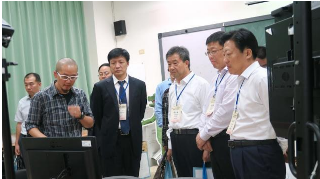
參觀數媒系專業教室